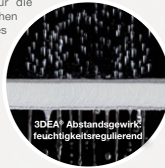
3DEA® Abstandsgewirk: feuchtigkeitsregulierend

Das Ergebnis: So werden selbst bei langem oder dauerhaftem Liegen Wärme- und Feuchtestaus verhindert. Auf diese Weise können diese Produkte zu einem effizienten Therapie-Management und sogar zur Dekubitusprophylaxe beitragen.