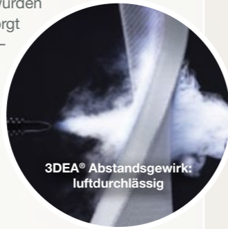
3DEA® Abstandsgewirk: luftdurchlässig

Gleichzeitig sorgen die Matratzen für ein optimales Schlafklima: Das atmungsaktive 3DEA® Material an der Oberseite sorgt für einen ständigen Luftaustausch mit der Umgebung. So wird ruhiger und entspannter Schlaf möglich, der wesentlich zu Wohlbefinden und Lebensqualität beiträgt.